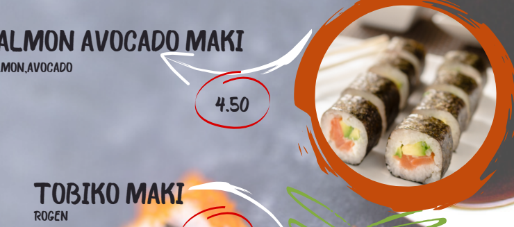
4.50 SALMON AVOCADO MAKI SALMON, AVOCADO