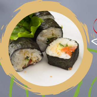
4.50 TUNA KAPPA MAKI LACHS, GURKE