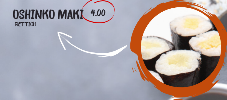
4.00 OSHINKO MAKI RETTICH