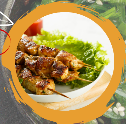
BAO BUN FLUFFIGE TEIGTASCHEN MIT FRIED RIND