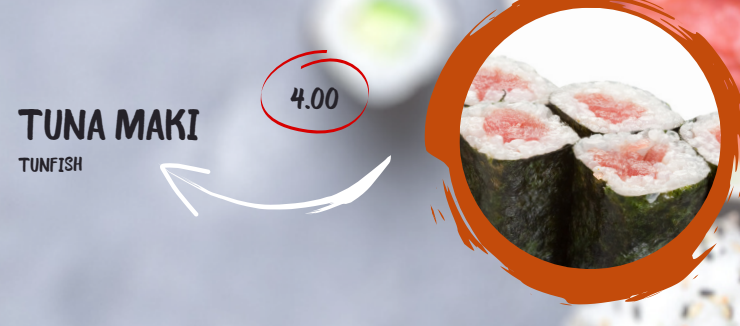
4.00 TUNA MAKI TUNFISH