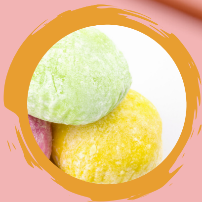
MOCHI GREEN TEE