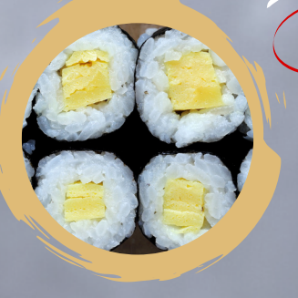
4.00 TAMAGO MAKI TAMAGO