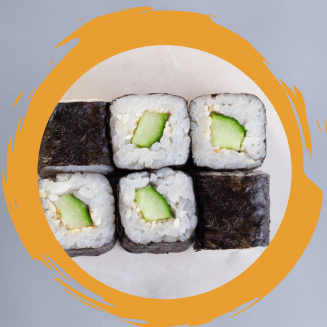
4.00 KAPPA MAKI GURKE