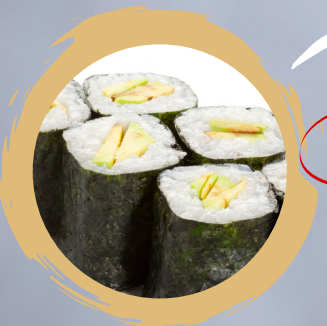
4.00 AVOCADO MAKI AVOCADO