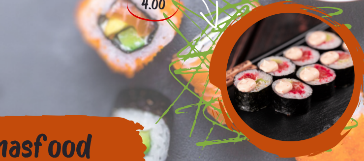
4.00 TOBIKO MAKI ROGEN