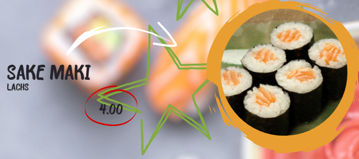
4.00 SAKE MAKI LACHS