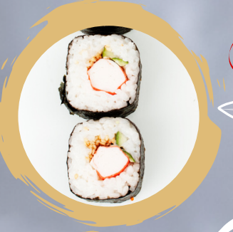
4.00 SURIMI MAKI SURIMI